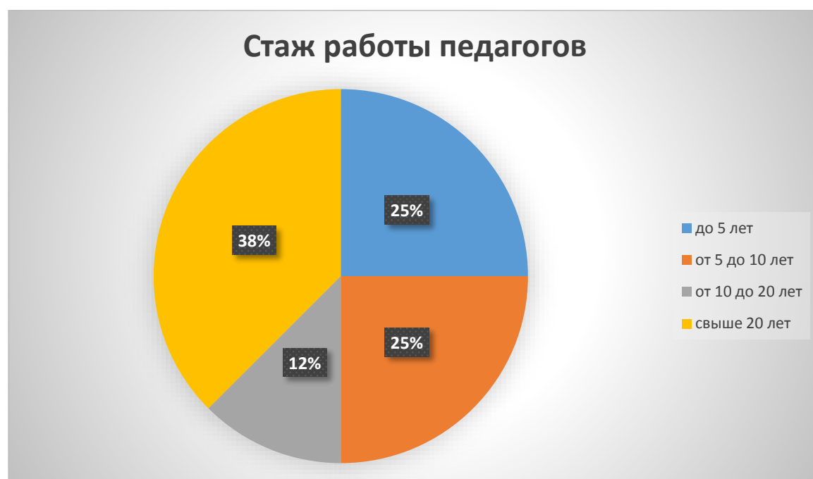
Диаграмма с характеристиками кадрового состава ДОУ